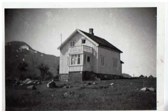
Huset som far bygde i Almåsen

I Vegdalen var steinen ryddet unna slåttmarka men i Almåsen måtte vi bryte den opp fra myra og bære den på plass en den skulle lagres, som steingjerde eller i en haug.