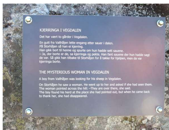
Gammelt sagn som nå står i Vegdalen

At det var mye hulder i Vegdalen trodde vi og det gjorde de voksne også.