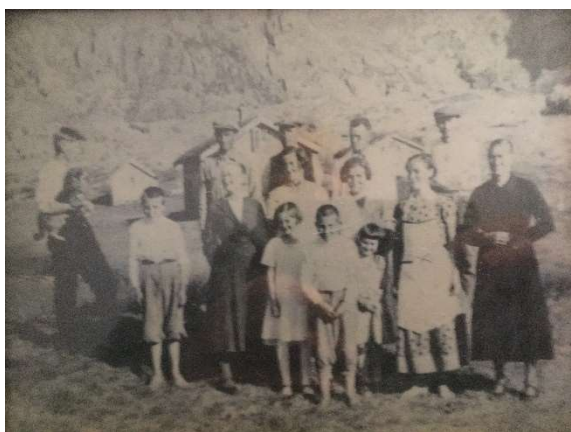
Vegdalsfamilien, jeg står midt på bildet i nikkers

Den gangen var det typiske leker for gutter og jenter. Jentene lekte med dukker og kastet ball. Når vi slo ball og sprang sisten måtte alle være med i leken.