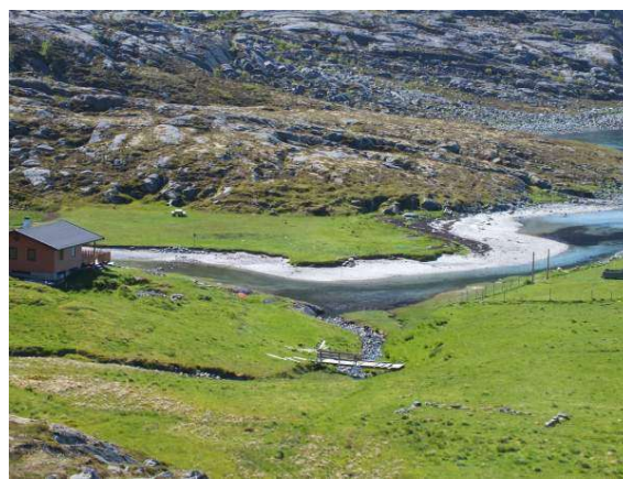
Steinmuren nederst på bildet viser hvor huset vårt sto

Bror min og jeg rettet ut lin angler som vi surret på tykke stenger. I osen brukte vi stengene til å stikke små sandflyndre med. Det hente også at vi trådte på flyndra og stakk en av tærne på foten i stedet for fisken. Vi fisket også små ørret som onkel til far brukte som agn på uer snikene. Det hente at vi fikk noen ører for ørretene og det var stor stas.